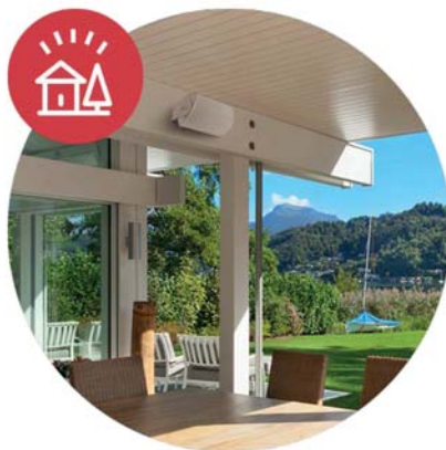
광범위한 커버리지 배플 디자인