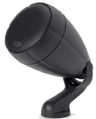
Deck & Wall Mounting