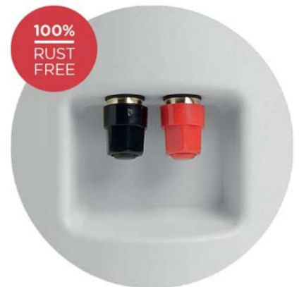
스테인리스 스틸 및 황동 하드웨어의 알루미늄