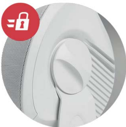
스피드 락 마운팅 시스템