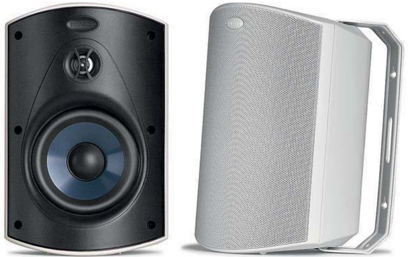
Atrium6 : 5.5" Drivers and 1" Tweeters, 블랙 Atrium5 : 5" Drivers and 0.75" Tweeters, 블랙/화이트 Atrium4 : 4.5" Drivers and 0.75" Tweeters, 블랙/화이트