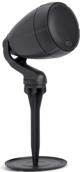
Ground Mounting With Security Plate

갑판이나 벽에 설치하십시오. 퀵 체인지 펜던트 마운트를 사용하여 천장에서 떨어 뜨리거나 스피커 지면마운트를 사용하여 바닥에 내려 놓고 최적의 성능을 위해 스피커 각도를 조정하십시오.