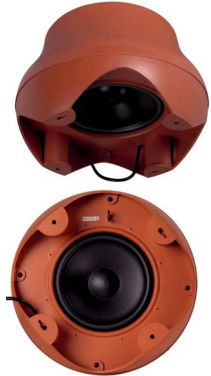
200W 하향식 서브 우퍼는 말 그대로 땅을 흔드는 저음을 전달합니다. 10 인치 장거리 다이내믹 밸런스 드라이버는 높은 볼륨에서도 더 깊고 깨끗한 저음을 위해 왜곡을 제거합니다.

사계절 야외 서브 우퍼 전체 치수 : 42.86CM 직경 X 27.94CM H 색상 : 그레이/ 타코 전체 주파수 응답 : 40Hz-200Hz. 자세한 내용은 사양 참조